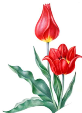
д) Тюльпан Шренка