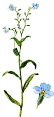
г) Незабудка болотная