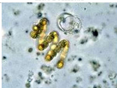
г) цианобактерии (устаревшее название – синезелёные водоросли)