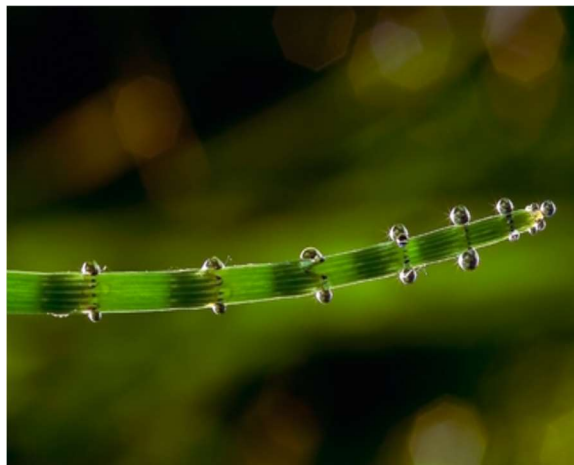
Пример гуттации у хвоща

На фотографии, которая была сделана до выпадения росы, изображён побег хвоща с капельками влаги. При этом весь день было влажно и пасмурно, но дождя накануне не было. Можно предположить, что капельки жидкости выделяет само растение. Может ли это явление (гуттация) быть каким-то образом полезно растению?