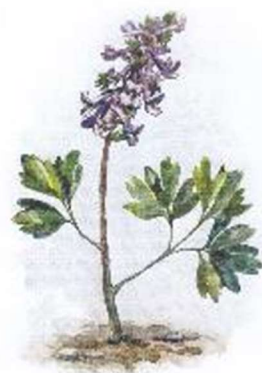
е) Хохлатка плотная