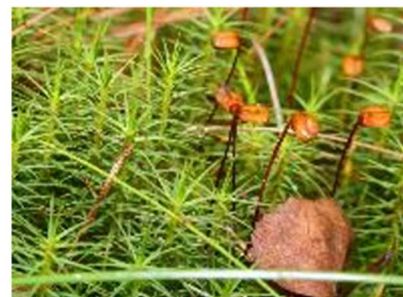
в) зелёный мох кукушкин лён