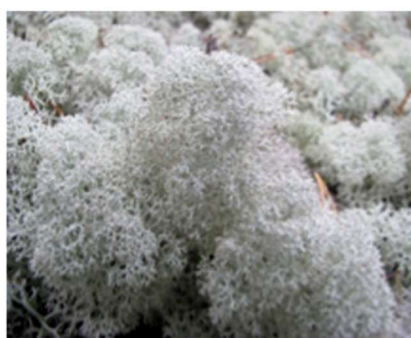
б) лишайник ягель (виды родов кладина и кладония)