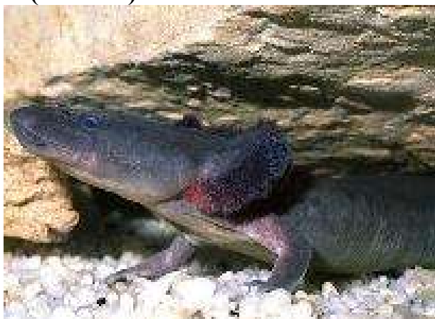
А) протей американский