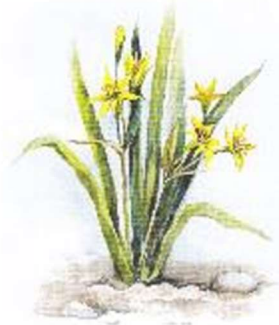
б) Гусиный лук, или Гейджия