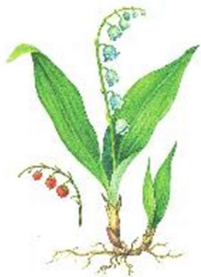
а) Ландыш майский

Весеннецветущие растения, или первоцветы – это многолетние травянистые растения с непродолжительным периодом цветения. Выберите первоцвет, у которого в распространении семян участвуют муравьи. Данный вид занесён в Красную книгу города Москвы.