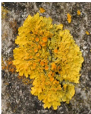
а) лишайник ксантория настенная

Среди представленных организмов выберите те, которые выполняют в экосистеме роль продуцентов.