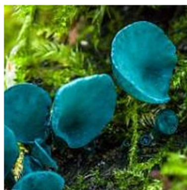
д) гриб хлороспленнум сине-зелёный