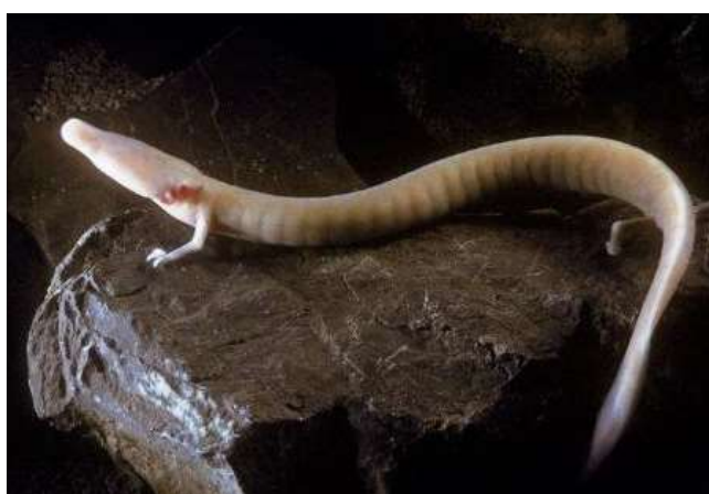
Б) протей европейский