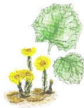
в) Мать-и-мачеха обыкновенная